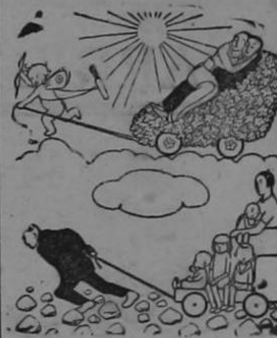
ANTES Y DESPUES

—El confesor es, sin querer, el más oyente de los cuentos más deliriosos y más atrevidos.