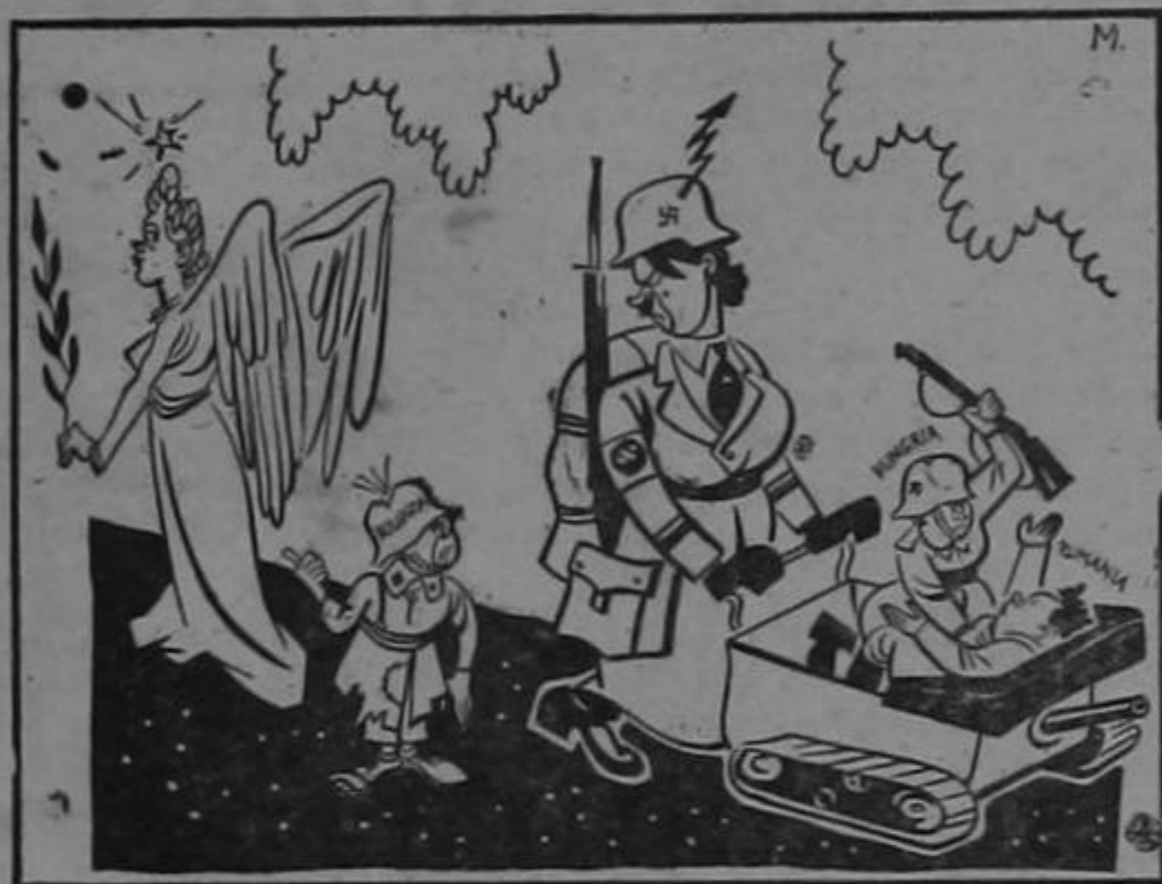
Esa niñera me gusta mucho más...